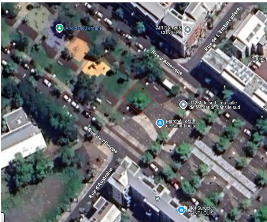
Espace sur l'esplanade de la Zac Avenir