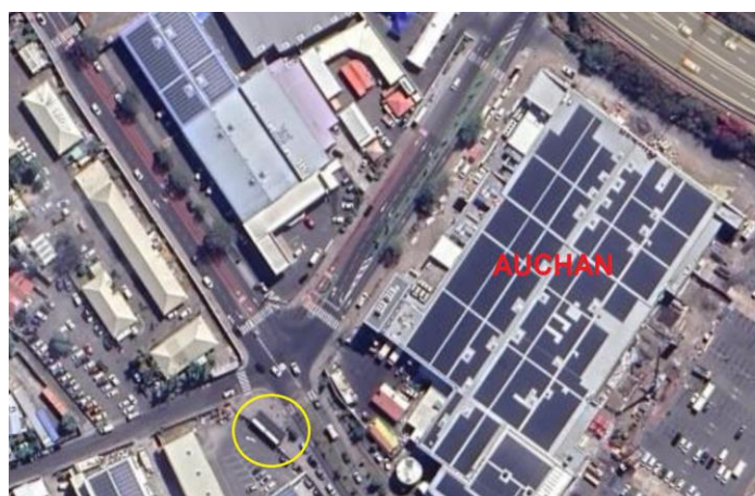
Kiosques économiques 28 A et 28 B Avenue de Toulouse

Adresse : 28 A et 28 B avenue de Toulouse – Bel Air.